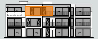
achtergevel blok 2