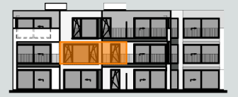
achtergevel blok 2